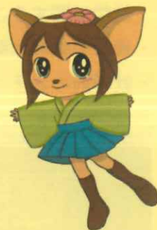
鹿嶋市公式キャラクター ナスカちゃん

鹿嶋市教育センターは、市内の子どもたちの健全やかな成長に向けて、先生方はもとより、子どもたちと保護者の方々を総合的・専門的に支援するため、2015年（平成27年）10月、旧鹿嶋市保健センター跡にて開所しました。